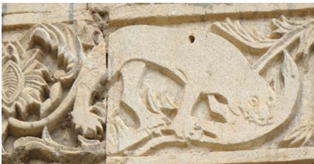
تصویر ۶. نقوش پلنگ در ردیف سوم نمای قره‌کلیسا (نگارندگان، ۱۳۹۷).

نمادپردازی اسب بسیار پیچیده است. الیاده اسب را حیوانی می‌داند که در آئین‌های پرستش همراه آئین‌های خاکسپاری آمده است. اسب را نماد باستانی حرکت چرخشی جهان و پدیده‌ها نیز می‌دانند. همچنین اسب را نماد آرزوهای شدید و غرایز و نیز وسیله‌ای برای سواری دانسته‌اند. در میان مردم باستان رودزیا، هر سال برای خورشید اسب قربانی می‌کردند. اسب را به مارس نیز هدیه می‌کردند و ظهور ناگهانی یک اسب را نشانه جنگ می‌دانستند (اخوان اقدم، ۱۳۹۳: ۴۱). در هنر مسیحیت، اسب را نماد سرقدیس، آناستازیوس، هیبولیتوس و کیرینوس دانسته‌اند (اسماعیل پور، ۱۳۸۶: ۵۱۸).