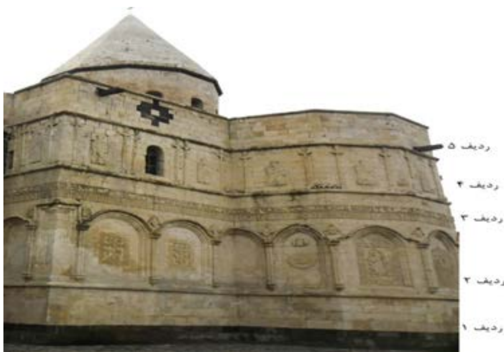
تصویر ۳. نمایی از ضلع جنوبی و ردیف‌بندی نقوش کلیسای غربی (سفید)، (نگارندگان، ۱۳۹۷).

اژدها: در پایه‌ستون ناقوس قره‌کلیسا نقش یک اژدها حجاری شده است. در این نقش یکی از قدسیین معروف به «سن ژرژ» که سوار بر اسب و مسلح به سپر و نیزه است، در حال نبرد با اژدهایی است که زیر پای اسب او قرار گرفته است. در واقع اژدها در این تصویر به‌عنوان نماد اهریمن و شر ترسیم شده است (تصویر ۴).